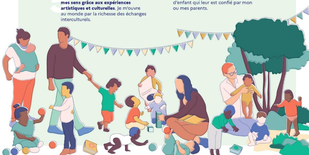
Cette charte établit les principes applicables à l'accueil du jeune enfant, quel que soit le mode d'accueil, en application de l'article L. 214-1-1 du code de l'action sociale et des familles. Elle doit être mise à disposition des parents et déclinée dans les projets d'accueil.