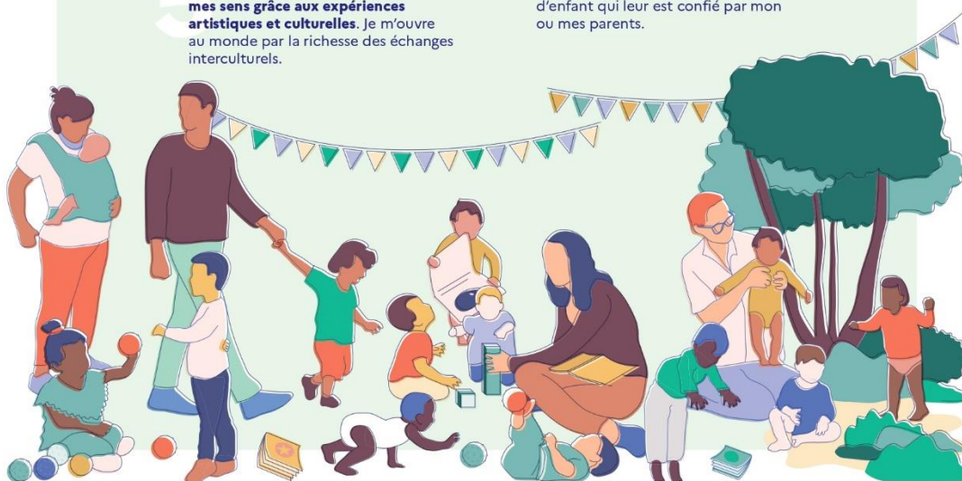
Cette charte établit les principes applicables à l'accueil du jeune enfant, quel que soit le mode d'accueil, en application de l'article L. 214-1-1 du code de l'action sociale et des familles. Elle doit être mise à disposition des parents et déclinée dans les projets d'accueil.

10 J'ai besoin que les personnes qui prennent soin de moi soient bien formées et s'intéressent aux spécificités de mon très jeune âge et de ma situation d'enfant qui leur est confié par mon ou mes parents.