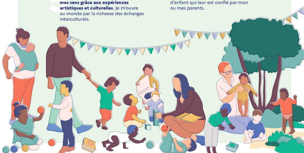
Cette charte établit les principes applicables à l'accueil du jeune enfant, quel que soit le mode d'accueil, en application de l'article L. 214-1-1 du code de l'action sociale et des familles. Elle doit être mise à disposition des parents et déclinée dans les projets d'accueil.